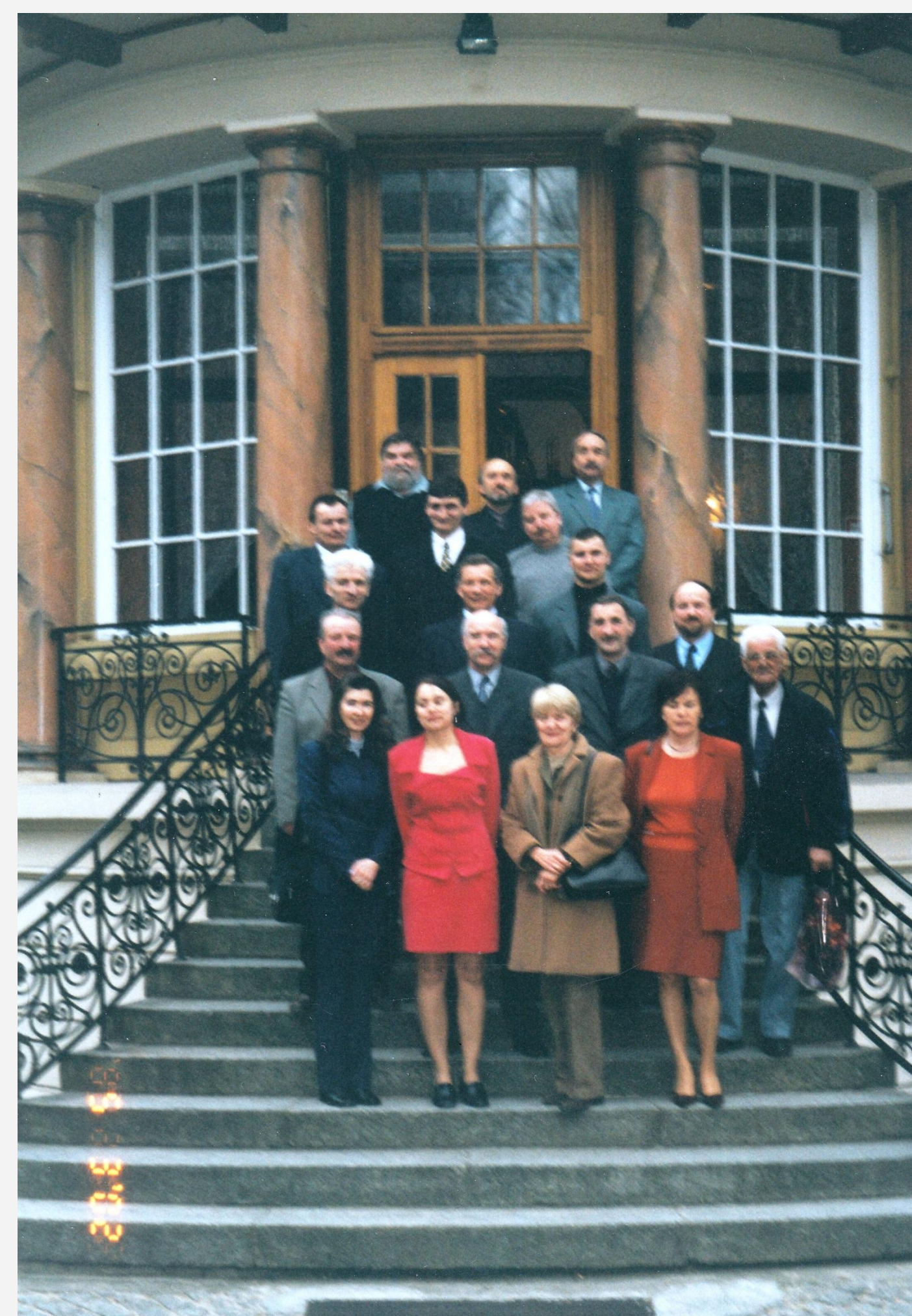
Spotkanie po konferencji w Ośrodku Wypoczynkowo-Szkoleniowym w Porażynie (2002)